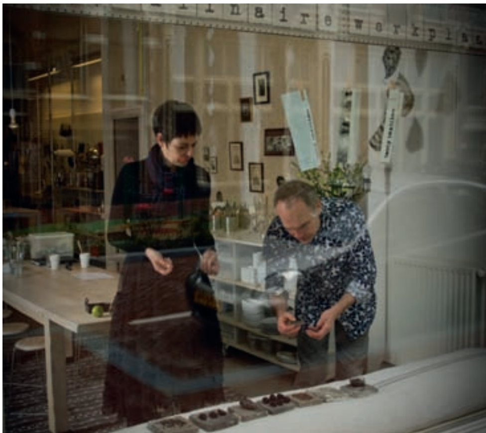
De Culinaire Werkplaats heeft elke maand een mini-expositie in het thema.