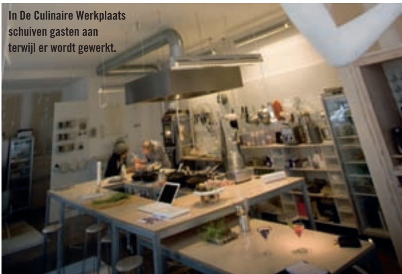
In De Culinaire Werkplaats schuiven gasten aan terwijl er wordt gewerkt.