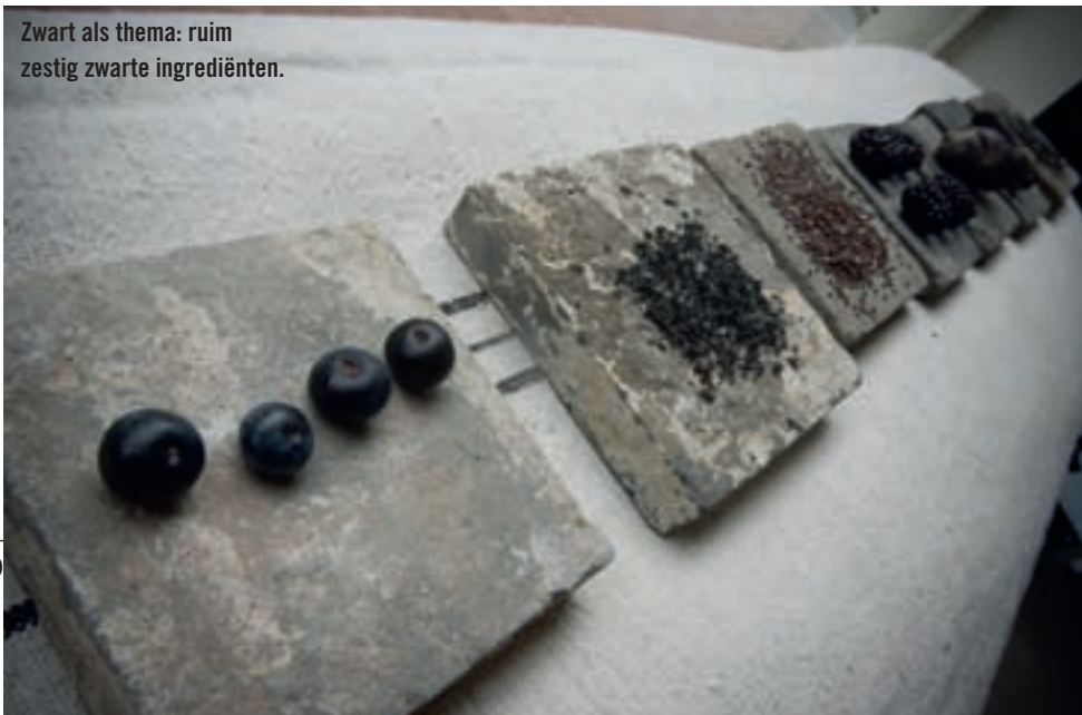
Zwart als thema: ruim zestig zwarte ingrediënten.