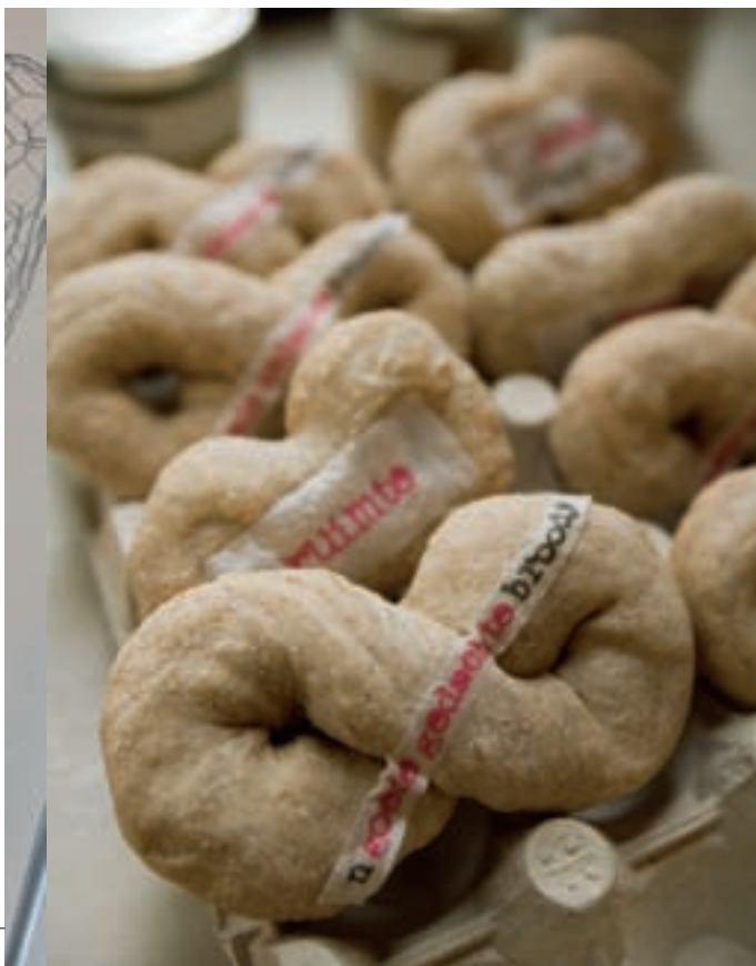
Wintjes gebruikt emoties als ingrediënten voor brood.

ten zijn nog niet eindeloos doorgekookt om ze te perfectioneren. Veel chefs doen dat vóór ze het hun gasten voorzetten, ik doe dat terwijl die gasten al aan tafel zitten. Zo krijg je frisse, originele gerechten.”