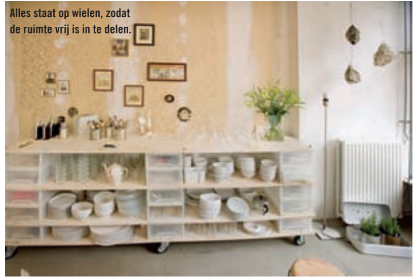
Alles staat op wielen, zodat de ruimte vrij is in te delen.