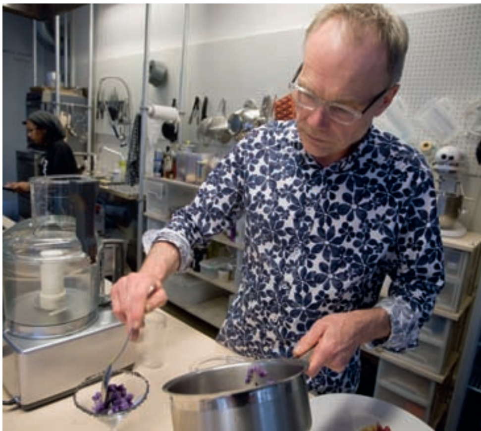
Meursing kookt zwart: salade van 'zwarte' aardappel met zwart zeezout.

Daarnaast werken ze voor een aantal opdrachtgevers duurzame eetconcepten uit, variërend van duurzame eventcatering tot haute vega/vegan voor het bedrijfsrestaurant. Bovendien werkt Meursing aan het project groentepatisserie, waarin hij een nieuwe kijk op deze