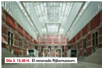
DÍA 3. 15:30 H. El renovado Rijksmuseum.