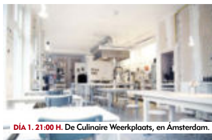
DÍA 1. 21:00 H. De Culinaire Weerkplaats, en Ámsterdam.

12:30 H. GOODBYE, VINCENT. Una comida ligera en Monsieur Jacques, dentro del museo, para probar sus productos orgánicos (www.monsieurjacques.nl) puede ser una opción antes de dirigirse al aeropuerto de vuelta. Si dispone de más tiempo, puede volver a Ámsterdam para terminar con más arte viendo un famoso autorretrato de Van Gogh en el renovado Rijksmuseum. ◀