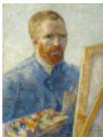
AUTORRETRATO. De 1888, es uno de los que se exhiben en el Museo Van Gogh.

17:00 H. VINCENTE: REPASO A UNA BIOGRAFÍA. En Neunen se encuentra el VinCentre (Berg, 29), espacio que revisa su biografía, tan controvertida como sujeta a interpretaciones (www.thevincentaffair.nl).