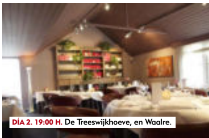
DÍA 2. 19:00 H. De Treeswijkhoeve, en Waalre.