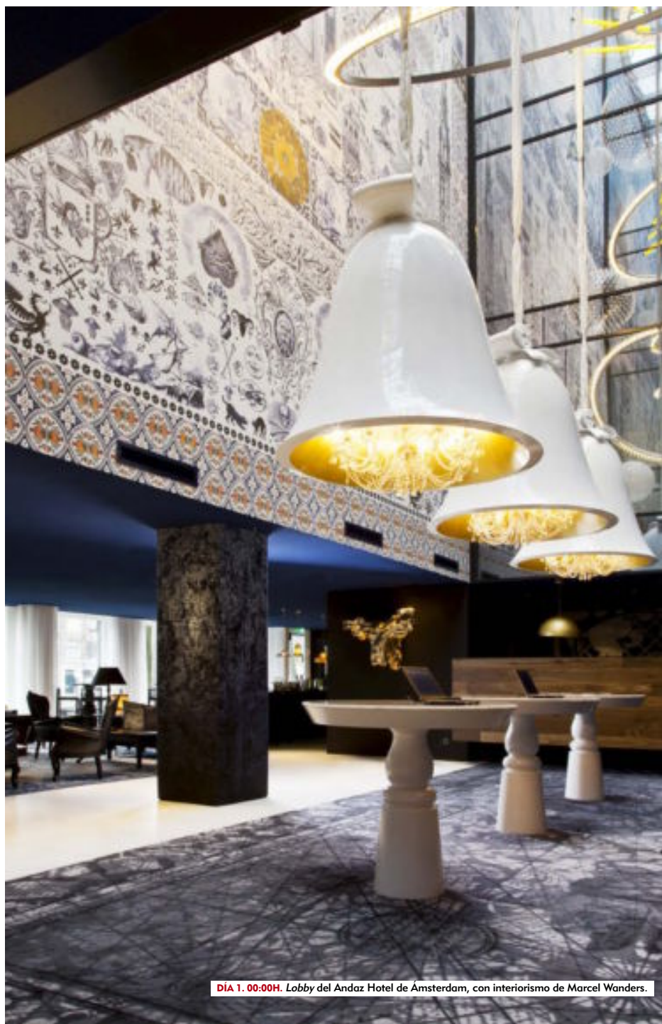
DÍA 1. 00:00H. Lobby del Andaz Hotel de Amsterdam, con interiorismo de Marcel Wanders.