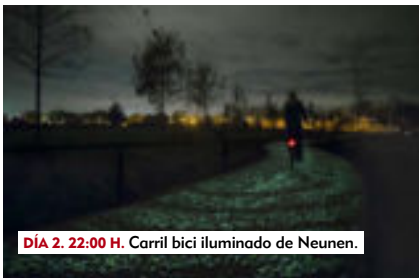
DÍA 2. 22:00 H. Carril bici iluminado de Neunen.